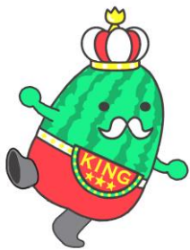
にゅうぜんフラワーロード 2026